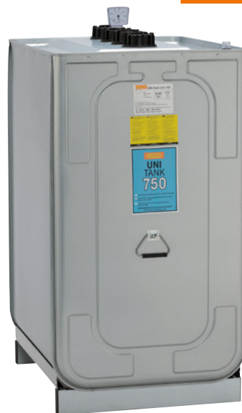
Uni-Tank 750 I