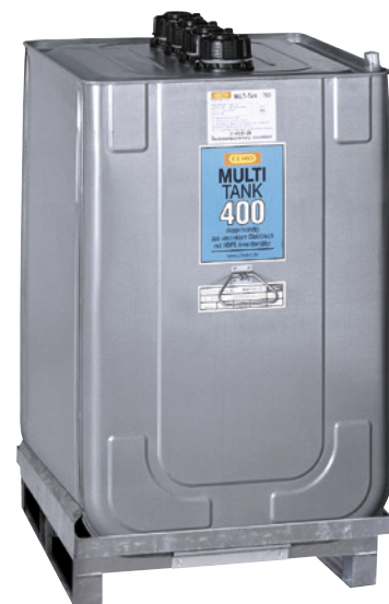
MULTI-Tank mit Stahlblechpalette.