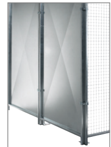
Optional verzinkte Rückwand.