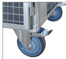
Anbausatz Räder mit Bodenplatte.