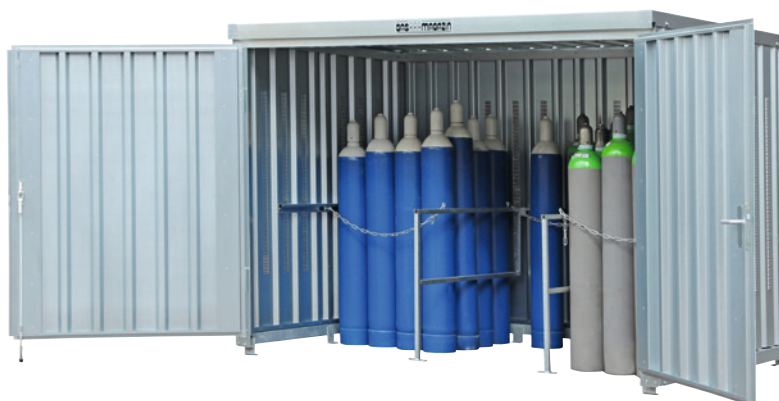
Typ 366, ohne Boden, mit zusätzlicher Endmontage und Haltevorrichtungen.