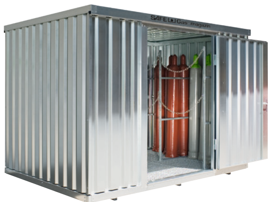
Typ 348, mit Boden, zusätzlicher Endmontage und Haltevorrichtungen.

* In Verbindung mit zusätzlichen Gitterrostebenen