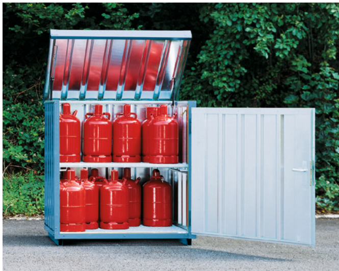
Typ GB 1 mit zusätzlicher Gitterrostebene und Außenwandlackierung.