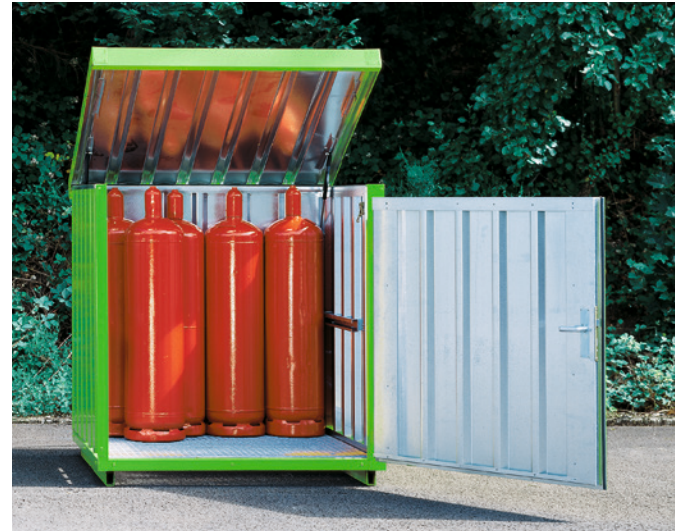
Typ GB 2 mit zusätzlicher Außenwandlackierung.