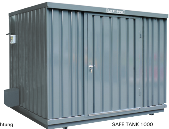
SAFE TANK 1000