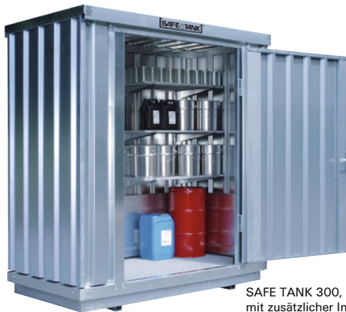
SAFE TANK 300, mit zusätzlicher Inneneinrichtung

Die Gefahrstofflager sind auch für die aktive Lagerung von brennbaren Stoffen erhältlich. Neben den abgebildeten Standardtüren gibt es weitere Türvarianten.