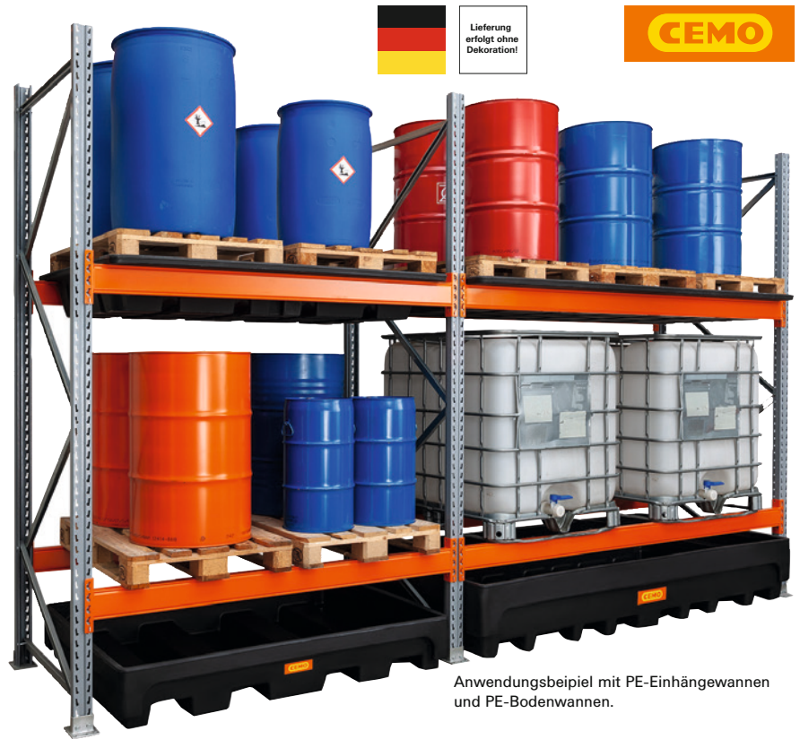
Anwendungsbeispiel mit PE-Einhängewannen und PE-Bodenwannen.