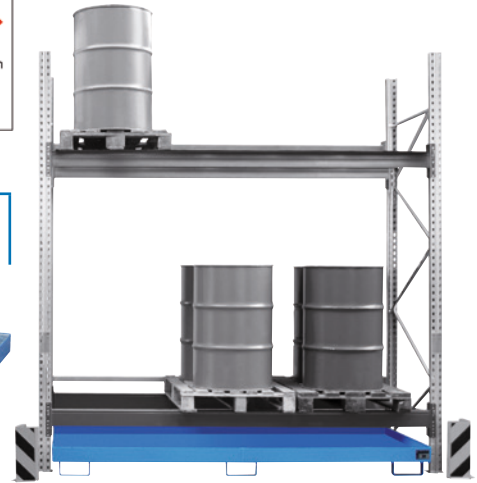
Regalwanne für Regal mit Trägerlänge 2700 mm.