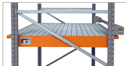
Einhängewanne für Trägerlänge 1800 mm.