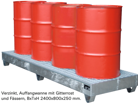
Verzinkt, Auffangwanne mit Gitterrost und Fässern, BxTxH 2400x800x250 mm.