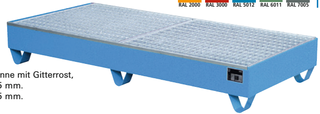
RAL 5012, Auffangwanne mit Gitterrost, BxTxH 1800x800x275 mm. BxTxH 1800x800x275 mm.