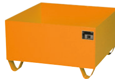
RAL 2000, Auffangwanne ohne Gitterrost, BxTxH 800x800x460 mm. BxTxH 800x800x460 mm.