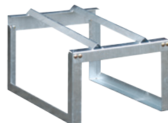
für 1x 200-l-Fass