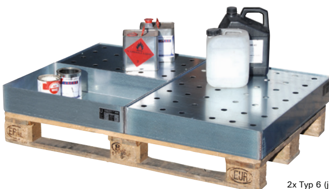
2x Typ 6 (je 1x mit bzw. ohne Lochblechrost) und 1x Typ 7 mit Lochblechrost.

Wannen sind kombinierbar und passen genau auf Euro- und Chemiepaletten.