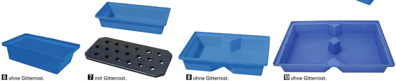
6 ohne Gitterrost.