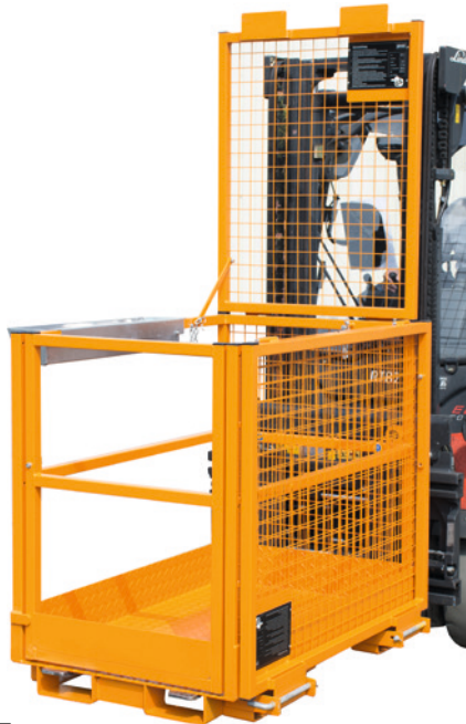
1 Zur Längsaufnahme