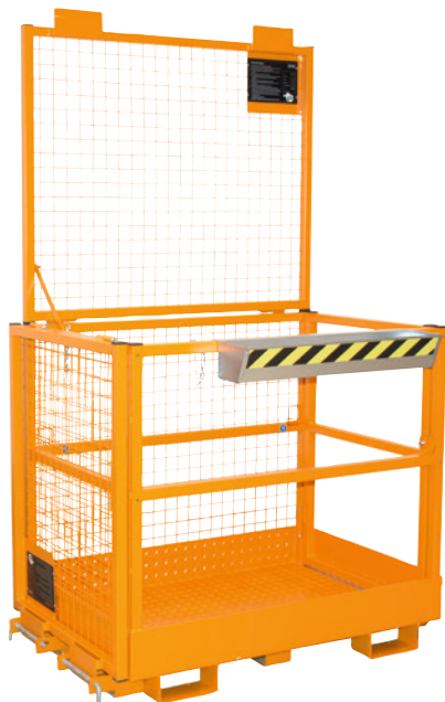
1 Aufnahme an der Breitseite