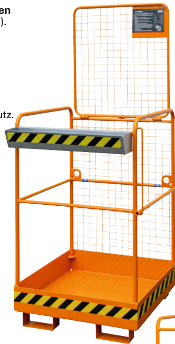
1 Aufnahme an der Schmalseite, Sicherungsstange