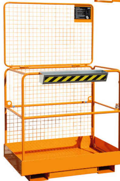
3 Aufnahme an der Breitseite, selbst verriegelnde Tür