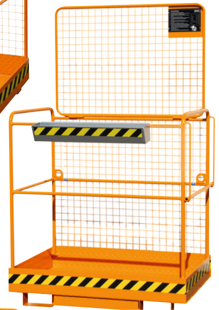
2 Aufnahme an der Breitseite, Sicherungsstange