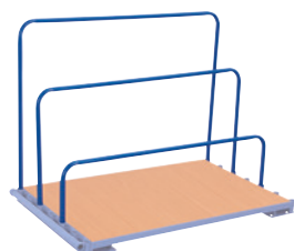
2 + 4