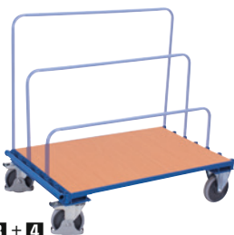
3 + 4