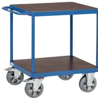
1 Quadratische Ladefläche

fetra-Zentralbremssystem Erklärung siehe Seite 3/19.