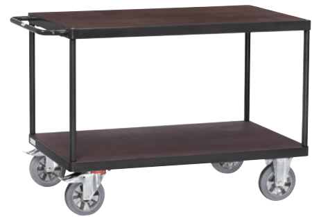
2 Rechteckige Ladefläche