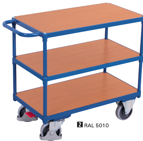
2 RAL 5010