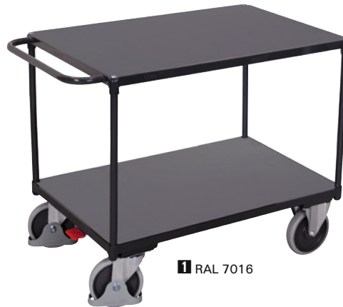
1 RAL 7016