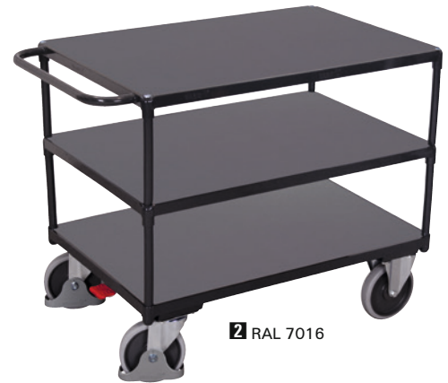
2 RAL 7016