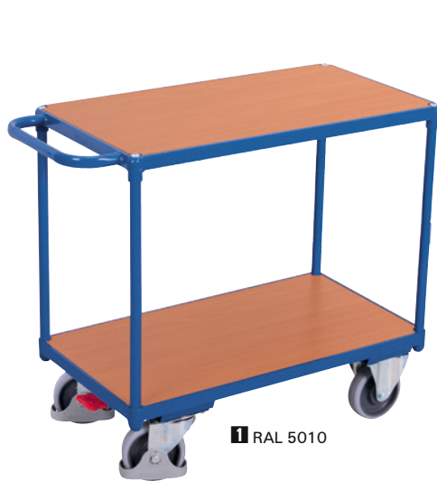
1 RAL 5010

VARIOfit® Zentralbremssystem Erklärung siehe Seite 3/18