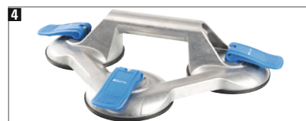
4 Aluminium-Körper, besonders geeignet für große Scheiben. Tragkraft ca. 100 kg, mit kunststoffummanteltem Griff.