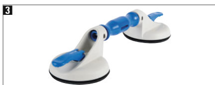
3 Kunststoff-Körper, großflächiger, rutschfester Griffbereich, ergonomischer und bedienerfreundlicher Kipphebel, Tragkraft ca. 50 kg.