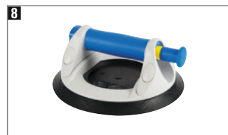
8 Griff mit rutschfester Ummantelung, Tragrichtung parallel, Vakuumsicherheitsanzeige, Tragkraft 120 kg, Lieferung im Koffer.