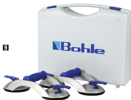
9 Set im Transportkoffer. Ausführungen siehe Tabelle.