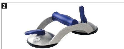
2 Aluminium-Körper, tausendfach bewährt. Tragkraft ca. 70 kg, kunststoffummantelter Griff.