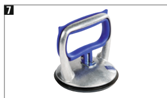
7 Alu-Körper, mit einer Hand zu bedienen. Tragkraft ca. 30 kg.