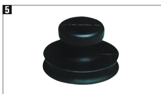
5 Saugheber 80 mm Ø, aus Vollgummi. Tragkraft 15 kg.