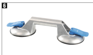
6 Alu-Körper. Tragkraft ca. 60 kg.