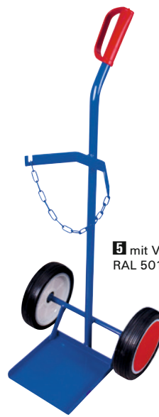
5 mit Vollgummi-Bereifung, RAL 5010.