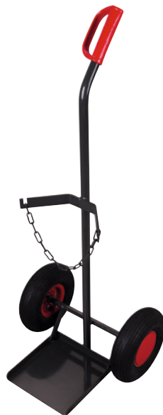
5 mit Luftbereifung, RAL 7016.