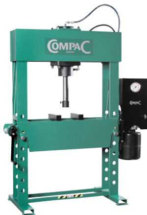
Modell EP60 mit einfach wirkendem Zylinder.