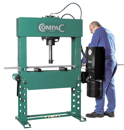
Modell EP40D mit doppelt wirkendem Zylinder.