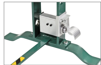
Fußbedienter pneumatischer Schnellhub (Modellreihe FP/HP 20-25).