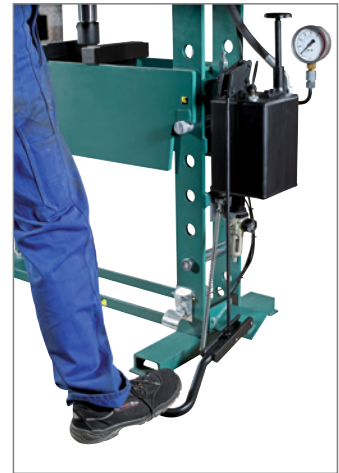
Freie Hände durch Fußbedienung (Modellreihe FP20-25).