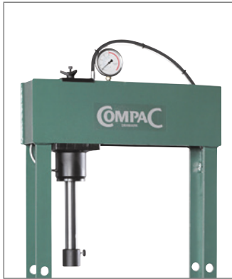
Seitwärts verschiebbarer Presszylinder.