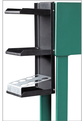
Ablageplatten (ohne das abgebildete Zubehör)