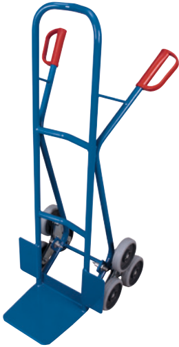
1 RAL 5010