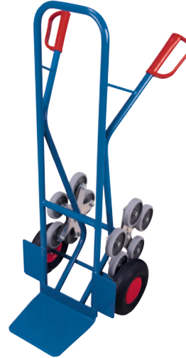
2 RAL 5010