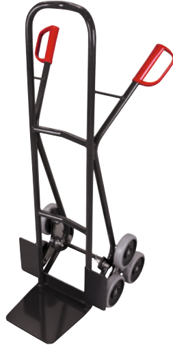
1 RAL 7016