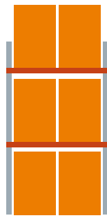
Abbildungen beziehen sich auf Europaletten 1200x800 mm.

3 Lagerebenen Grundfeld 1 Feld je 1800 mm 6 Palettenplätze