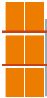
Anbaufeld 1 Feld je 1800 mm 6 Palettenplätze