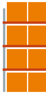
Abbildungen beziehen sich auf Europaletten 1200x800 mm.

4 Lagerebenen Grundfeld 1 Feld je 1800 mm 8 Palettenplätze