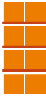
Anbaufeld 1 Feld je 1800 mm 8 Palettenplätze