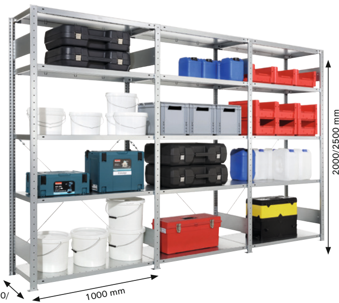
Abb. zeigt 1 Grundregal und 2 Anbauregale