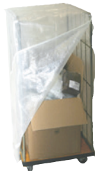
3/182 Abdeckhaube für Rollcontainer