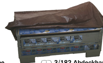
3/182 Abdeckhaube für halbe Gitterbox