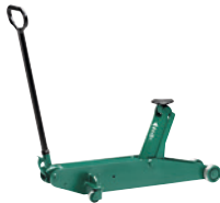
3/136 Hydraulischer Rangier- und Hochheber