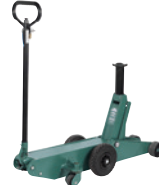
3/137 Rangierheber, lufthydraulisch