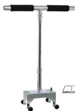
3/188 Tragehilfen für Akku-Saugheber