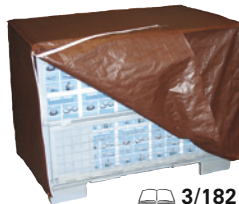
3/182 Abdeckhaube für Gitterbox