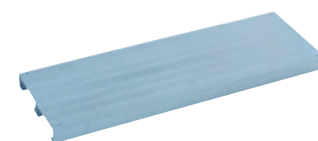
Geriffelte Aluminium-Stufe (Standard-Lieferumfang).