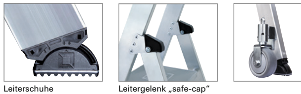
Leiterschuhe Leitergelenk „safe-cap“