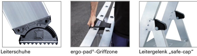
Leiterschuhe ergo-pad®-Griffzone Leitergelenk „safe-cap“