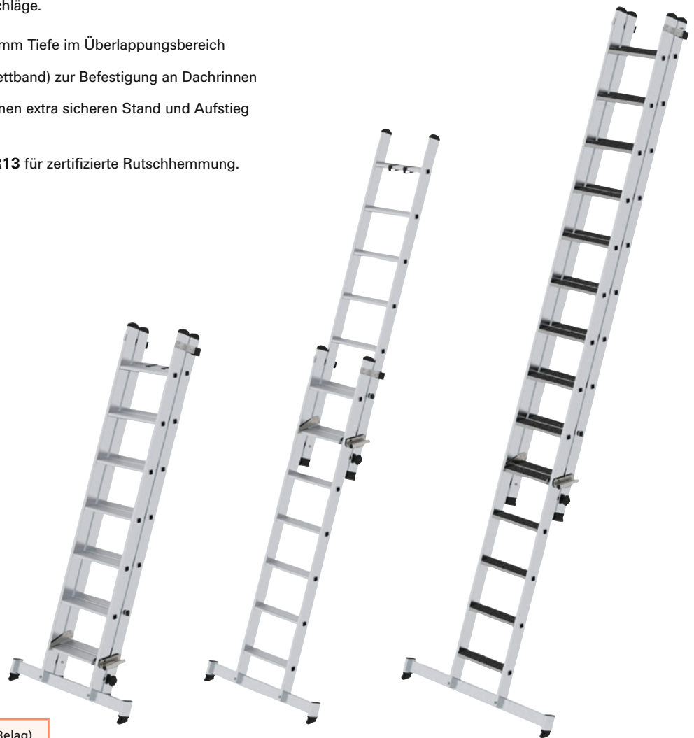
ohne clip-step R13