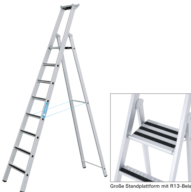
Große Standplattform mit R13-Belag. Stufen mit R13-Belag.