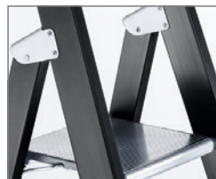
Standplattform 250x250 mm (Megastep S)