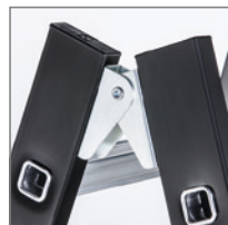
Robuste Stahlscharnieren (Megastep B)