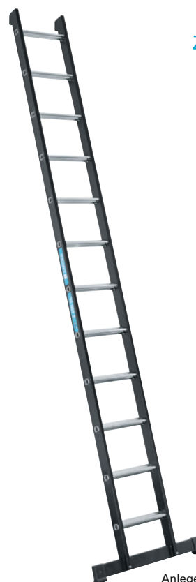
Anlegeleiter (Megastep L)