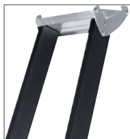
Praktische Ablageschale (Megastep S)