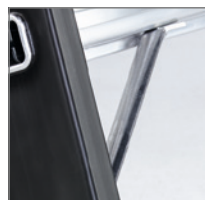
Sprossenaussteifung für hohe Belastbarkeit.