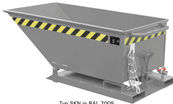
Typ SKN in RAL 7005