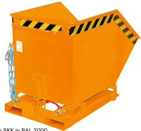
Typ SKK in RAL 2000