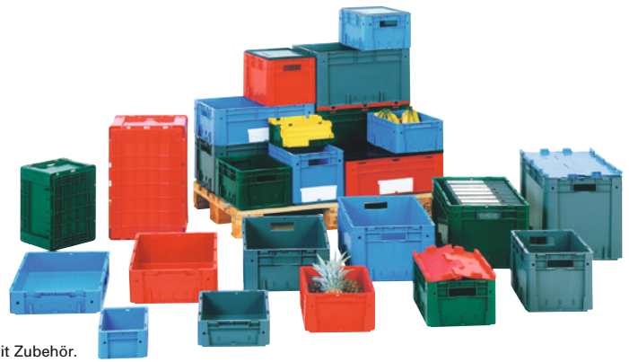
Abb. zeigt verschiedene Behälterausführungen mit Zubehör.

Optimierte Seitenwandkonstruktion. Griffe an den Stirnseiten. Wände geschlossen, Boden geschlossen. Rollenbahn geeignet. Etikettenhalterung an allen 4 Seiten. Lieferung in günstigen Verpackungseinheiten.