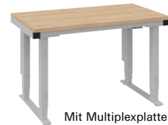
Mit Multiplexplatte und elektrischer Höhenverstellung.