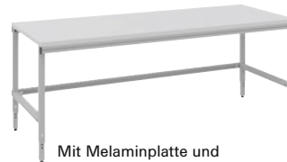
Mit Melaminplatte und manueller Höhenverstellung.