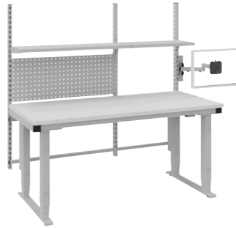
Mit Melaminplatte und elektrischer Höhenverstellung.

Hinweis zur Tragkraft: Ohne Arbeitsplatte hat der multi4easy folgende Tragkraft: manuell verstellbar max. 300 kg, elektrisch verstellbar max. 500 kg. Wichtige Einschränkung durch die verwendeten Platten: Melaminharzbeschichte Platten max. 200 kg. Hartlaminatplatten max. 200 kg. ESD-Platten max. 200 kg. Multiplex-Platten max. 500 kg.