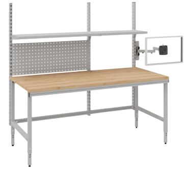
Mit Multiplexplatte und manueller Höhenverstellung.