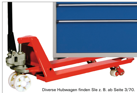
Diverse Hubwagen finden Sie z. B. ab Seite 3/70.