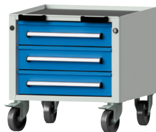
Typ 19 V