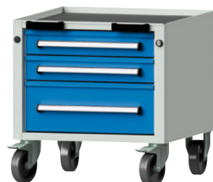
Typ 17 V