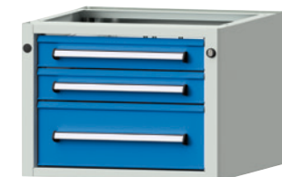
Typ 1205 V