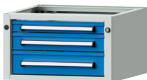
Typ 905 V