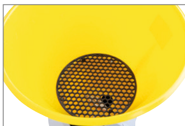
1 + 2 Einfüllsieb