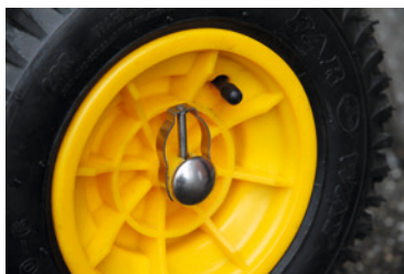
3 mit Radabschaltung