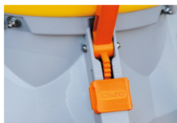
1 + 2 Streumenge einstellbar, mit festem Anschlag.