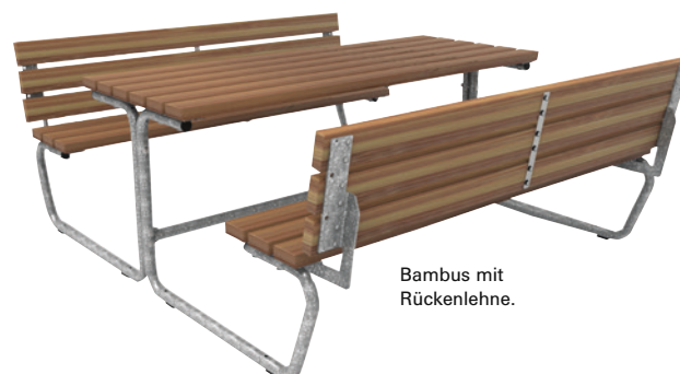
Bambus mit Rückenlehne.