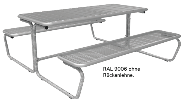
RAL 9006 ohne Rückenlehne.

TIPP Weitere Farben auf Anfrage lieferbar.