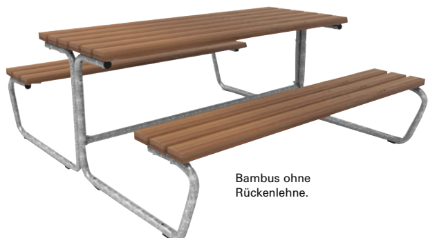
Bambus ohne Rückenlehne.