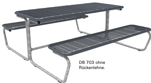
DB 703 ohne Rückenlehne.