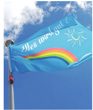
Fahnenmast mit Querformat Fahne.