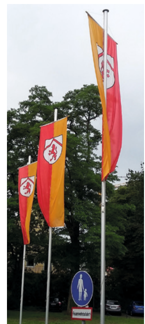
Fahnenmasten mit Bannerfahnen.