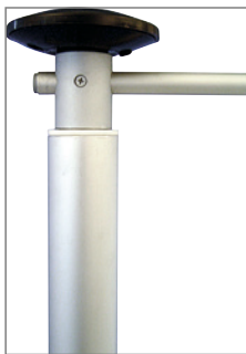
DKA Drehkopfausleger doppelt kugelgelagert , aus Alu-Vollmaterial. Nicht hissbar.