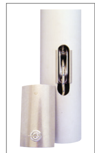
Typ HDKA-X, Masttür V2A mit Sicherheits- schloss für innen liegende Seilführung.