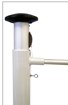
H-DKA Hissbarer Drehausleger mit doppelt kugelgelagerter Drehachse und hissbarem Führungsschlitten.