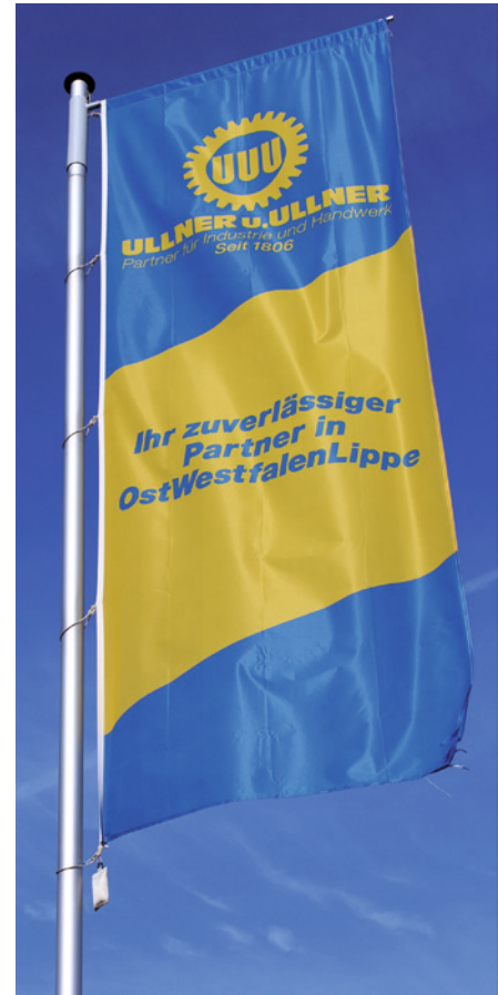
Fahnenmast mit H-DKA-Ausleger.