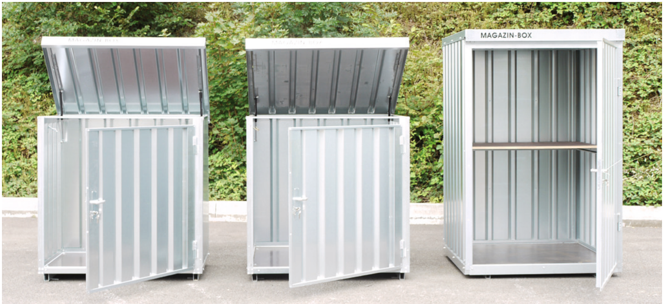
Typ 1 mit Boden.