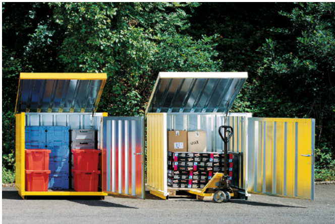
Magazinboxen Typ 1 mit Boden und Typ 2 ohne Boden. Das Dach wird durch 2 Gasdruckfedern gestützt. Die breite Tür erleichtert das Ein- und Ausladen. Optional mit Außenwandlackierung.