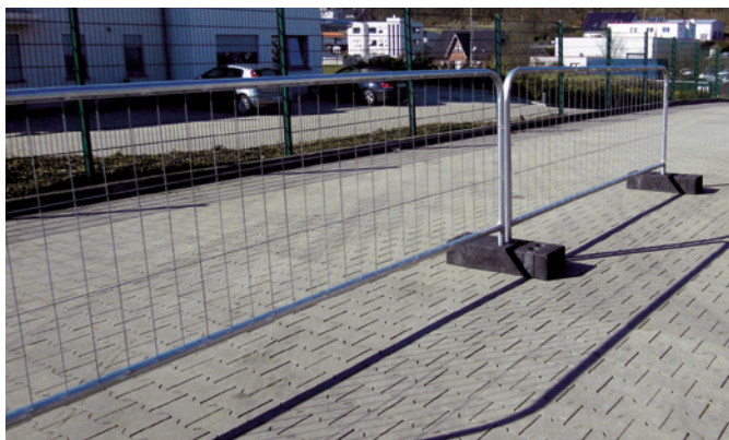
Mobilzaun Typ Event.