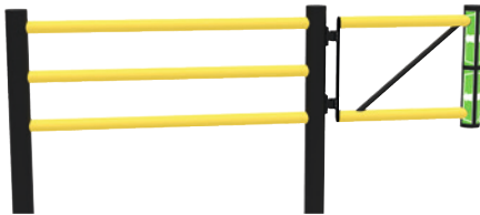
Schwingtür JULIET, z. B. am Mittelpfosten DELTA