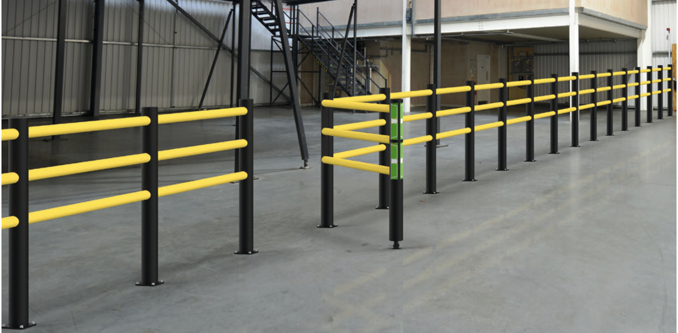
Schwingtür mit Rad.