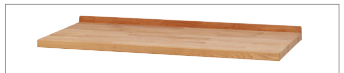
Abrollleiste zur Montage an der Plattenhinterkante.