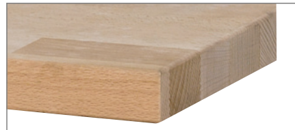
Platte Buche massiv, längsseitig riegelartig zahnverleimt, 40 oder 50 mm stark.