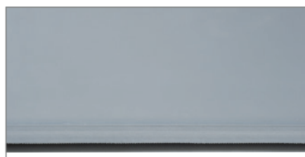
Yoga Flat Iso glatt.