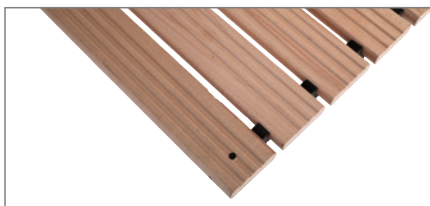
Typ B ohne Anlaufkeil und Schräge.