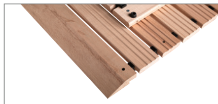
Typ F mit Anlaufkeil und Schräge.