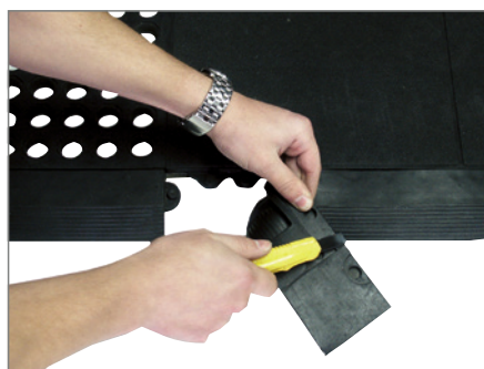
Einfach passend zuschneiden.