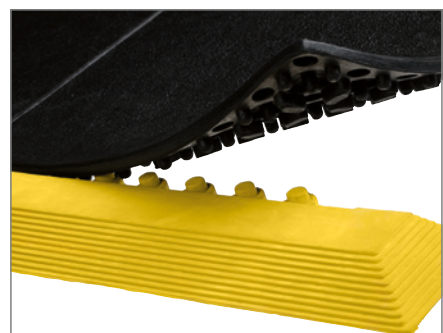
Leiste inkl. Ecke in gelb.