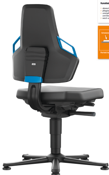
Nexxit 1 mit Gleitern und Integralschaum.