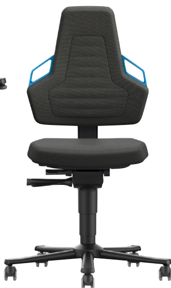
Nexxit 2 mit Rollen und Integralschaum.