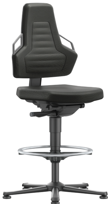
Nexxit 3 mit Gleitern, Fußring, Integralschaum und grauen Griffen.