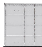
1/2 bis 1/4-Teilung