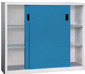
Höhe 1200 mm.