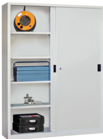
Höhe 1950 mm.