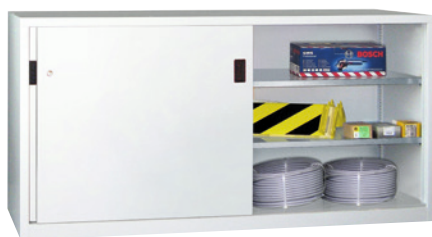
Höhe 1000 mm.