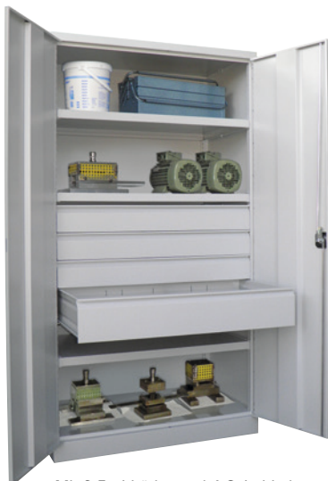
Mit 3 Fachböden und 4 Schubladen.