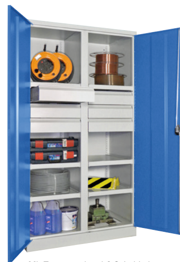
Mit Trennwand und 6 Schubladen.