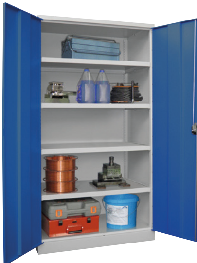
Mit 4 Fachböden.