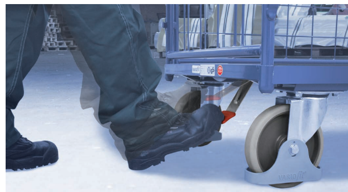
Einfach per Fuß zu betätigen...