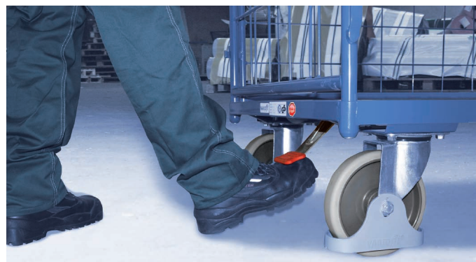
...und zu lösen.