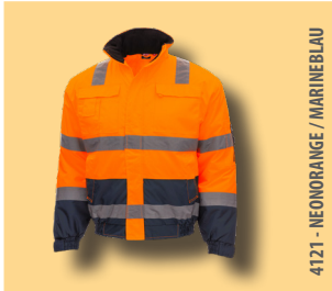
4121 - NEONORANGE / MARINEBLAU