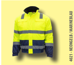
4021 - NEONGELB / MARINEBLAU